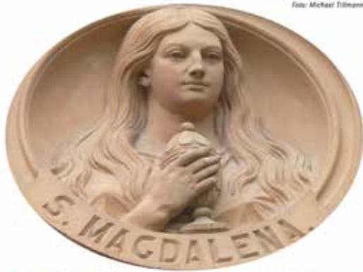
Am 22. Juli feiern wir das Fest der heiligen Maria Magdalena, Apostolin der Apostel wird sie genannt, weil sie den auferstandenen Herrn als Erste erlebt hat und von ihm den Auftrag bekam, den Jüngern die Osterbotschaft zu bringen.