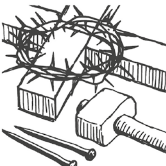
Karfreitag: Liebe leiden