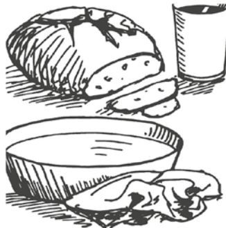
Gründonnerstag: Liebe teilen

Aufgrund der aktuellen Situation finden die Beisetzungen im engsten Familienkreis statt.