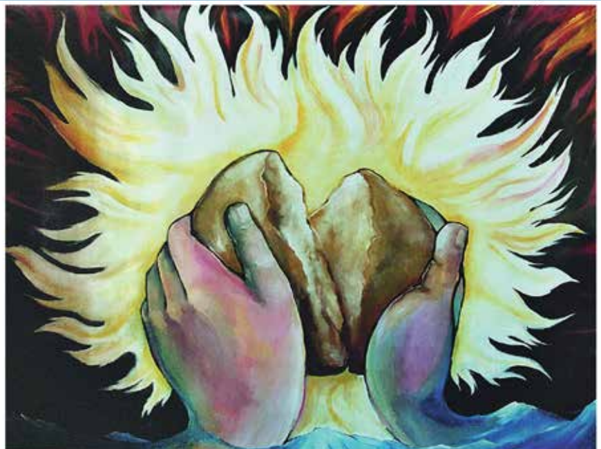
Dieses Bild kann niemand übersehen: 2x3 Meter groß, schmückt es den Speisesaal der Angestellten einer großen Sozialstation in einem Außenbezirk von Quito. Dominikanerinnen bieten dort auf vielfache Weise „Brot“ für Menschen, die kein dichtes soziales Netz trägt, sondern zumeist von der Hand in den Mund leben. Wer sich hier im Speisesaal an den Tisch setzt, der isst im Zeichen des geteilten Brotes. Der hat auch beim normalen Essen Aussicht auf die „Brot-Sonne“, kommt in Berührung mit dem „Meister im Brot-Teilen“.

Am Dienstag, 28.08.2018 von 17:30-19:45 Uhr + 2 Termine nach Absprache (6-8 Wochen Abstand) in Sögel, Seminarraum KEB, Am Markt 5, inkl. Abendimbiss. Dozentin: Marlies – Liesen Krause, Beraterin und Pädagogin. Kurs-Nr.: A43247. Kostenfreie Teilnahme! Hinweis: für eine vorausschauende Planung bitten wir um Ihre telefonische oder schriftliche Anmeldung bis möglichst Mittwoch, 22.08.2018 unter Tel. 05952 1556.