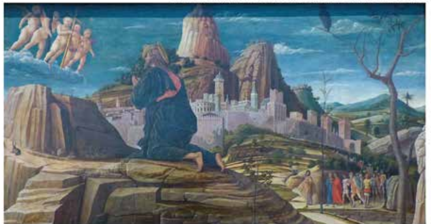
Andrea Mantegna (1430/31-1506), Die Qual im Garten, um 1458-1460